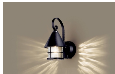
● ポーチ : LWC86744BK