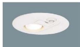
● 廊下 : LBC74275Z