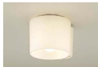
● トイレ : LBC56985