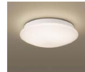
● 洗面 : HW8945GL