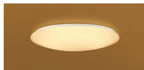
● 和室 : HFA7546