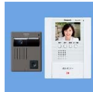
WQD230W(カメラ付ドアホン・親機)